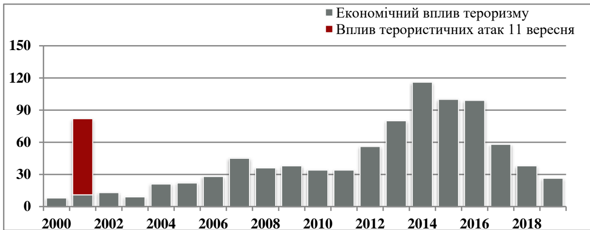
Рисунок 1. Тенденція економічного впливу тероризма, 2000–2019 рр.